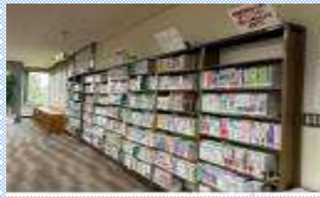
資格就職関連図書コーナー