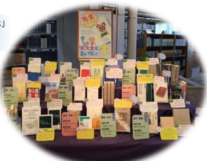
『先生おすすめ！札大生に読んでほしい本』展示の様子