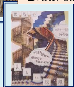
世界の美しい階段