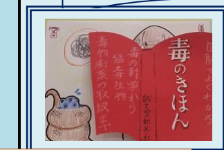
図解でよくわかる毒のきほん